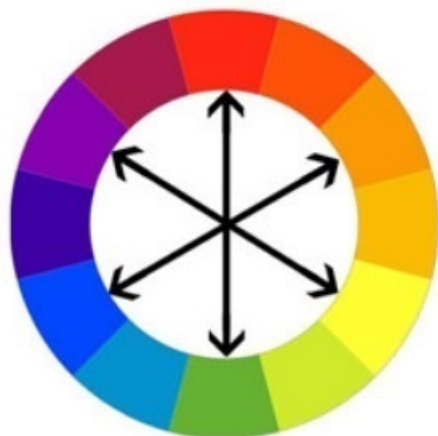
Couleurs Complémentaires Synthèse soustractive (CMJ)

Par exemple, à l'opposé du bleu, on trouve la couleur orange, à l'opposé du rouge on trouve le vert et à l'opposé du jaune on trouve le violet.